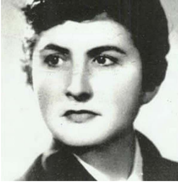
ÁNGELES ALVARIÑO. Oceanógrafa. Ferrol, España (1916-2005)

Precursora en la investigación oceanográfica mundial y destacada científica internacional. Experta en indicadores planctónicos para corrientes oceánicas y la pesca, descubrió 22 especies nuevas de organismos marinos.